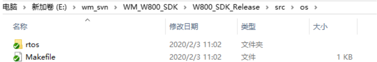
图 1 放置目录

如图 1 所示，SDK 的操作系统相关代码均放置在./Src/OS 目录下，目前已经移植了 FreeRTOS 实时操作系统。如果用户有需要使用其他实时操作系统，可以在此目录下建立新的文件夹，添加自己需要的操作系统